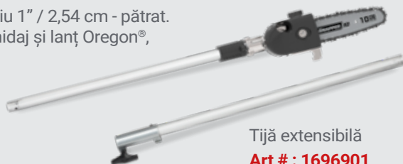
Tijă extensibilă Art #: 1696901