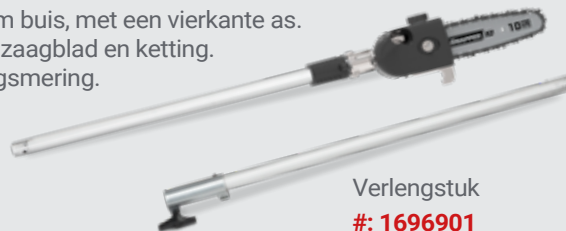
Verlengstuk #: 1696901