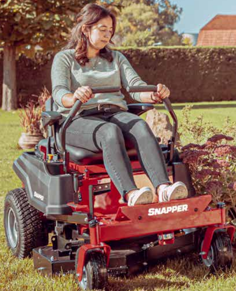
ZTX105 MET RD-KIT (ACHTERUITWORP)

De ZTX105 voegt een geheel nieuw prestatieniveau toe aan het uitgebreide Snapper zero turn gamma. Ontworpen voor maximale toegang tot de tuin. Deze compacte zero turn maaier kan op plaatsen maaien waar andere zero turn maaiers niet kunnen komen omwille van hun breedte. Het compacte formaat maakt het gemakkelijk om zelfs op de smalste delen van uw gazon te navigeren. Bovendien neemt hij minder ruimte in beslag bij het opbergen.