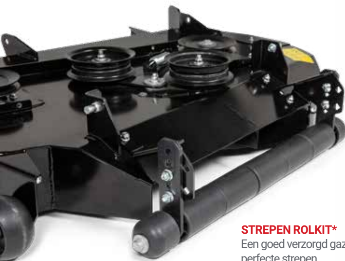
STREPEN ROLKIT* Een goed verzorgd gazon verdient perfecte strepen.