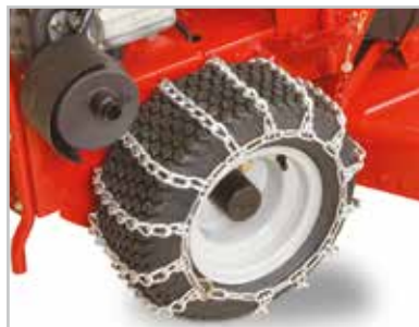
Catene da neve Per l'uso su superfici scivolose o innevate.