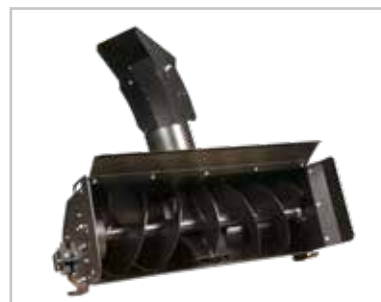
Spazzaneve da 100 cm (RTX) Accessorio ideale per le zone soggette a forti nevicate.