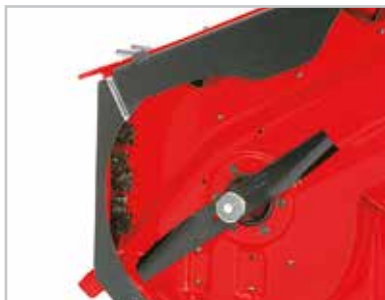
Kit mulching Converte facilmente il piatto al taglio mulching.