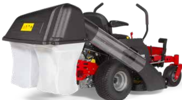
Raccolta a sacco doppio Raccogli l'erba tagliata con la tua zero turn.