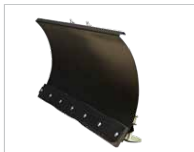
Lama da neve da 120 cm (RPX & RTX) Ideale per pulire sentieri e vialetti durante l'inverno.