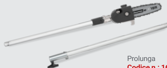
Prolunga Codice n.: 1696901