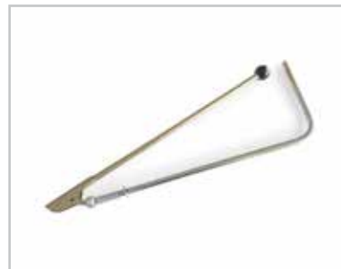
Raschietto per tunnel di scarico Elimina rapidamente e in modo sicuro eventuali ostruzioni nel tunnel di raccolta posteriore.