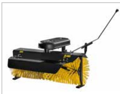
Spazzola da 120 cm (RTX) Elimina detriti e neve, per le superfici dure della tua proprietà.