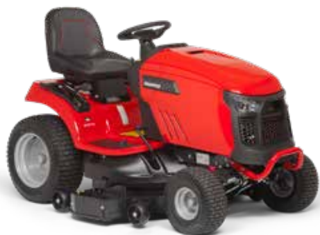
SPX275 con kit scarico posteriore montato