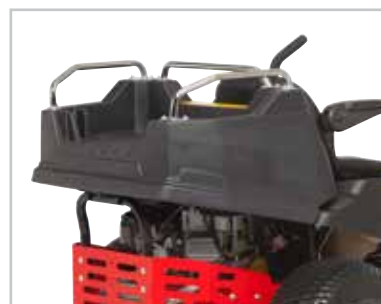
Cargo Bed Estendi la funzionalità della tua zero turn aggiungendo il cargo bed*.