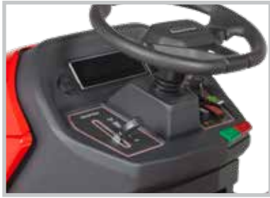
TABLEAU DE BORD ERGONOMIQUE

Le STX122 est équipé d'un régulateur de vitesse, d'un compteur horaire et d'un interrupteur RMO facilement accessibles. Il est également doté d'un écran LED clair et informatif, ainsi que de ports de recharge USB-A et USB-C.