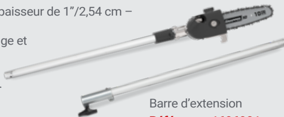
Barre d'extension Référence: 1696901