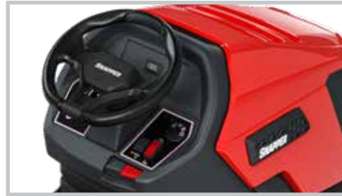
TABLEAU DE BORD ERGONOMIQUE

La hauteur de coupe peut être facilement réglée en 6 positions entre 30 et 90 mm.