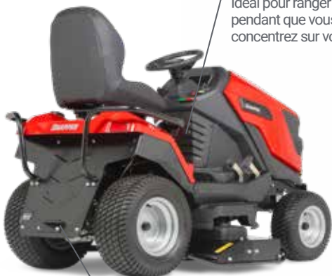
• Crochet d'attelage

Compartiment de rangement Idéal pour ranger vos outils pendant que vous vous concentrez sur votre travail.