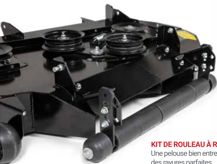
KIT DE ROULEAU À RAYURES* Une pelouse bien entretenue mérite des rayures parfaites.