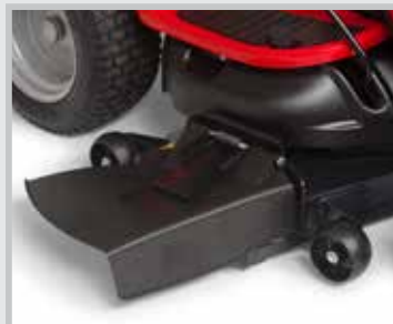
Avec kit d'éjection latérale