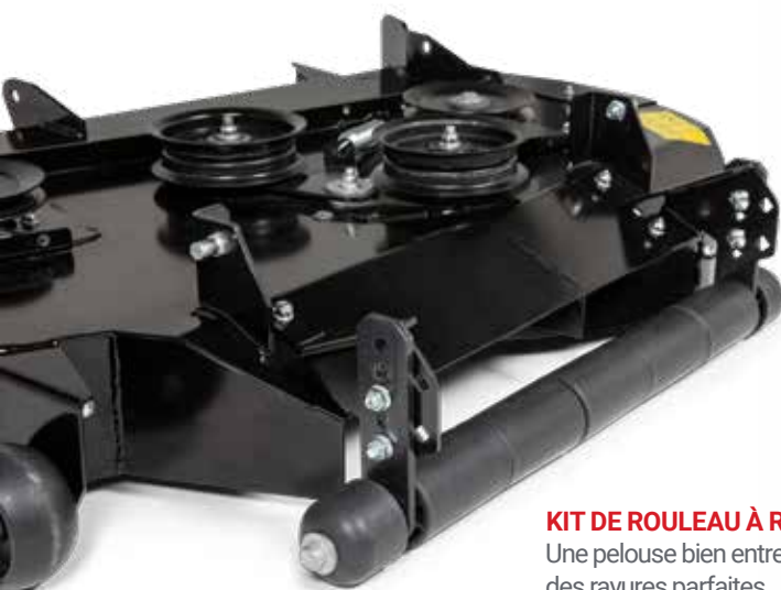
KIT DE ROULEAU À RAYURES* Une pelouse bien entretenue mérite des rayures parfaites.