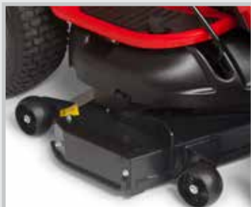
Avec kit d'éjection arrière

Le kit éjection latérale vous offre la plus grande capacité de coupe possible. Le kit éjection arrière est livré avec un déflecteur à mi-hauteur et des lames Eliminator®. Ce kit vous offre un équilibre parfait entre la puissance de tonte et les performances du mulching (50% de mulching). Toutefois, si vous souhaitez uniquement faire du mulching, il est préférable de monter le déflecteur à pleine hauteur (mulching à 100%). Ce kit garantit les meilleures performances mulching et est disponible en tant qu'accessoire (option). Si vous montez le kit de mulching en option, vous obtiendrez les meilleures performances de mulching.