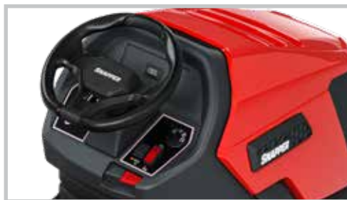
TABLEAU DE BORD ERGONOMIQUE

La hauteur de coupe peut être facilement réglée en 6 positions entre 30 et 90 mm.