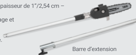
Barre d'extension Référence: 1696901