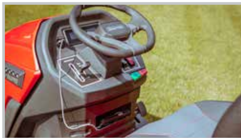
TABLEAU DE BORD ERGONOMIQUE

Le tableau de bord contient une prise USB-A et une prise USB-C, chacune délivrant 2,4 A maximum.