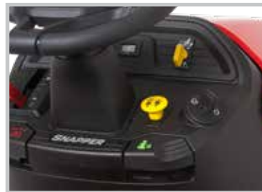
TABLEAU DE BORD ERGONOMIQUE

Essieu avant pivotant durable et roues avant montées sur roulements à billes.